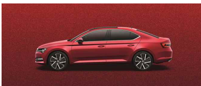
VELVET RED METĀLISKA