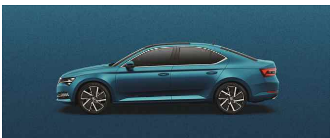
LAVA BLUE METĀLISKA