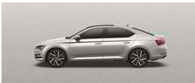
BRILLIANT SILVER METĀLISKA