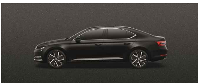
BLACK MAGIC METĀLISKA