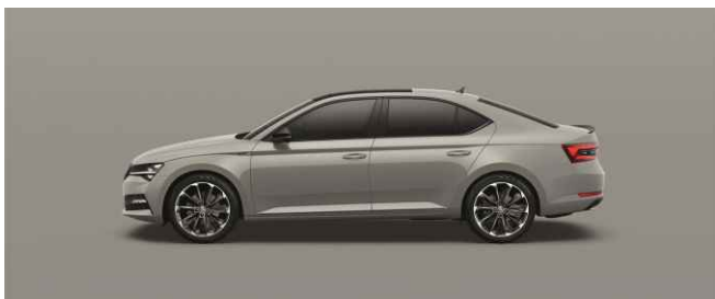
STEEL GREY METĀLISKA