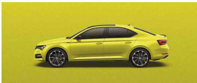
DRAGON SKIN METĀLISKA (Sportline)