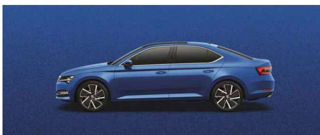
RACE BLUE METĀLISKA