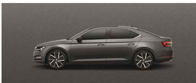
GRAPHITE GREY METĀLISKA