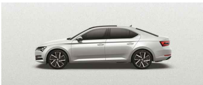
MOON WHITE METĀLISKA