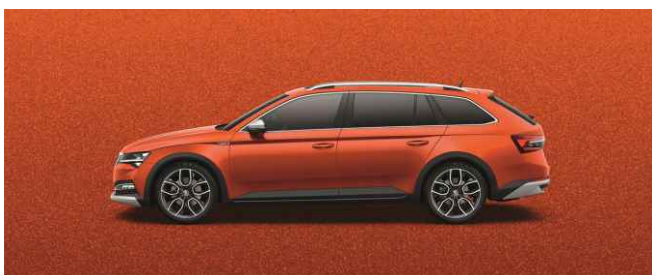
TANGERINE ORANGE METĀLISKA (Scout)