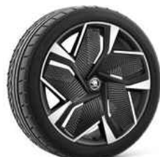
21" VISION AERO disku uzlikas 770 €