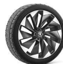
21" SUPERNOVA antracīta metālika 1 580 €