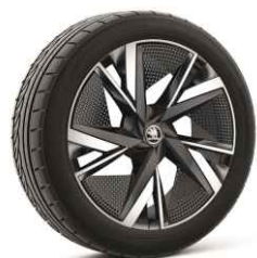
20" TAURUS 810 €