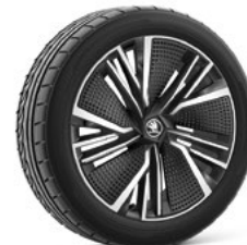
20" NEPTUNE AERO disku uzlikas 920 €