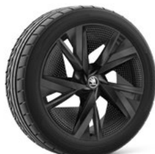
20" TAURUS BLACK AERO disku uzlikas