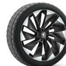
21" SUPERNOVA melna metālika 1 580 €