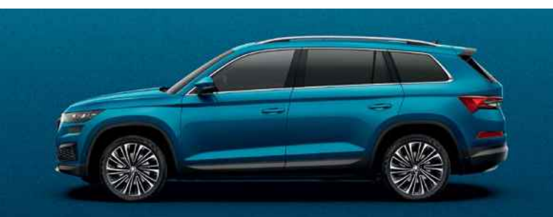
Metāliskā krāsa LAVA BLUE