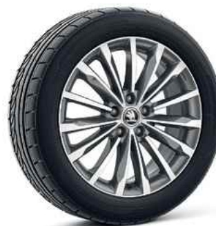
18 " vieglmetāla diski TRINITY antracīta