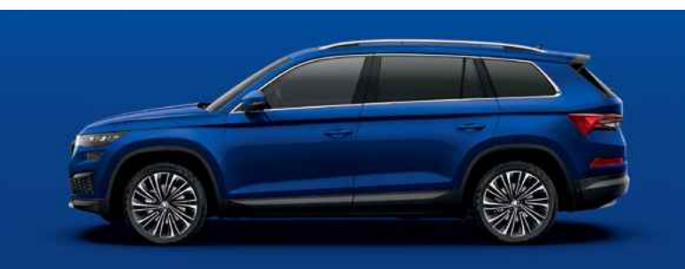
Standarta krāsa ENERGY BLUE