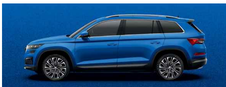
Metāliskā krāsa RACE BLUE