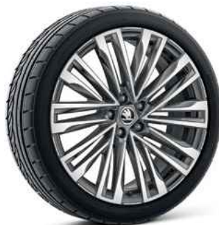
20" vieglmetāla disk MEROPE antracīta (L&K)